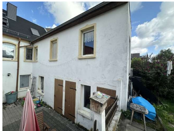
Ansicht Anbau / Außenanlagen